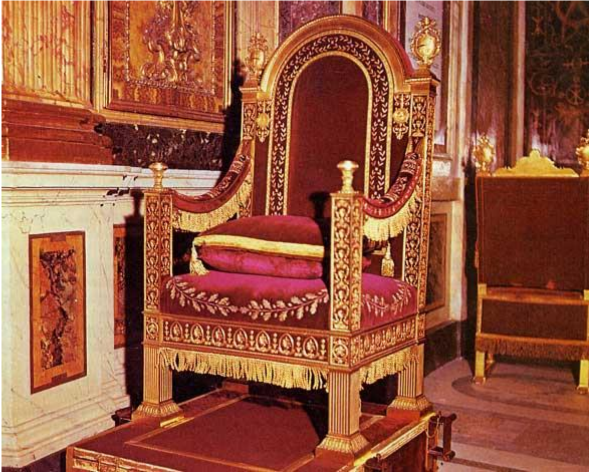
(Le soi-disant trône de Pierre, au Vatican)

Marc 12:40 » Gardez-vous des scribes, qui aiment à se promener en robes longues, et à être salués dans les places publiques; qui recherchent les premiers sièges dans les synagogues, et les premières places dans les festins; qui dévorent les maisons des veuves, et qui font pour l'apparence de longues prières. Ils seront jugés plus sévèrement. » ?